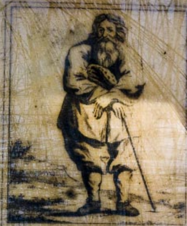
Per Olsson i Lund, etsning av J.E. Rehn, 1700-talet, andra hälft. Universitetsbiblioteket, Uppsala. Tryckt som planch till "Lefvernerbeskrifningar", Stockholm 1878.

Byn består av åtta hus, samtade runt ett torg som genomkorsas av två vägar. Husen som är panelade och rödfärgade, är i storlek och utformning mycket lika varandra. De är byggda på 1700-talet och under 1800-talet byggdes de på med överbyggnader.